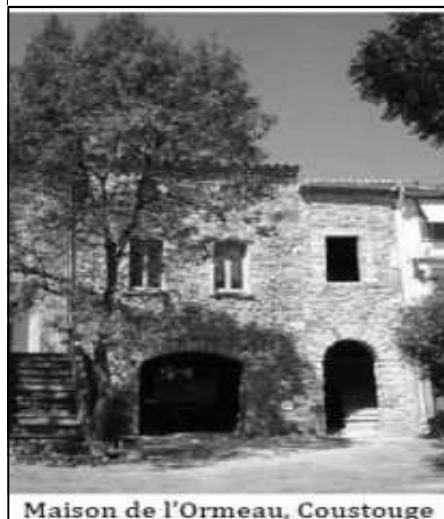
Maison de l'Ormeau, Coustouges